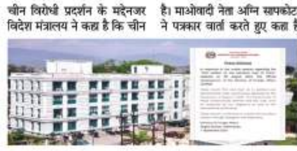
चीन विरोधी प्रदर्शन के मद्देनजर विदेश मंत्रालय ने कहा है कि चीन ने पत्रकार वार्ता करते हुए कहा है कि प्रधानमंत्री के चीन भ्रमण के समय बीजिंग में इस मुद्दे को उठया जाएगा। उन्होंने कहा कि नक्शा जैसे संवेदनशील विषय पर पड़ोसी देश को भी संवेदनशील तरीके से सोचना चाहिए।

काठमांडू। नेपाल के विदेश मंत्रालय ने एक बयान जारी करते हुए देश के नक्शे का सम्मान करने को कहा है। चीन के द्वारा जारी किए गए नक्शे पर आधिकारिक प्रतिक्रिया देते हुए विदेश मंत्रालय ने कहा कि नेपाल की संसद से जिस नक्शे को पारित किया गया उसका सम्मान सभी पड़ोसी देशों को करना चाहिए। विदेश मंत्रालय ने अपने बयान में कहा है कि नेपाल को विश्वास है कि नेपाल के नक्शे का सम्मान पड़ोसी देश और अंतरराष्ट्रीय समुदाय के द्वारा किया जाएगा। देश में चल रहे