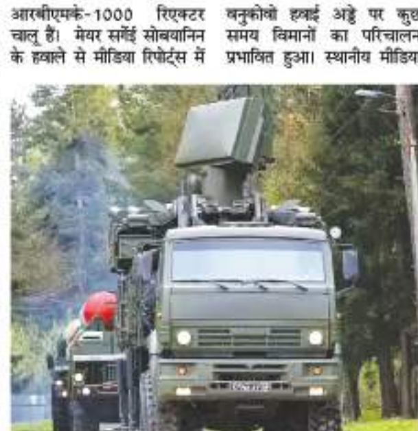
आरबीएमके-1000 रिएक्टर लघुकोको हवाई अड्डे पर कुछ चालू है। मेयर सर्गेई सोबयानिन समय विमानों का परिचालन के हवाले से मीडिया रिपोर्ट्स में प्रभावित हुआ। स्थानीय मीडिया की कुछ रिपोर्ट्स में यह भी दावा किया गया है कि पश्चिमी और मध्य रूस के क्षेत्रों में रातभर ड्रोन हमले हुए।