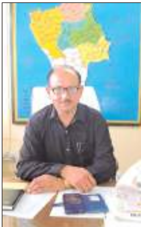
विभाग के कर्मचारियों के साथ मिलकर काम करेंगे