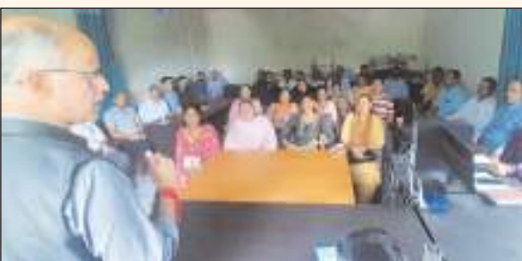
निभाता है। ऐसे में उपमंडल जोगिंद्रनगर के विभिन्न पटवारी सर्कलों में तेनात राजस्व कर्मी पटवारी नियमित तौर पर स्थानीय लोगों एवं पंचायत प्रतिनिधियों के संपर्क में रहें। इस मौके पर तहसीलदार जोगिंद्रनगर डॉ.

टीम एक्शन इंडिया/जोगिंद्रनगर/संगराय भारी बरसात के कारण आई प्राकृतिक आपदा एवं इससे प्रभावित लोगों को तुरन्त राहत एवं बचाव कार्य शुरू करने की दृष्टि से फील्ड में तेनात पटवारी एवं कानूनगो नियमित तौर पर लोगों के साथ संपर्क बनाए रखें। यह बातें एसडीएम जोगिंद्रनगर ने पटवारी एवं कानूनगो के साथ आयोजित बैठक में कहाँ उन्होंने कहा कि ग्रामीण स्तर पर प्राकृतिक आपदा से प्रभावित लोगों को सरकार की ओर से मिलने वाली राहत सामग्री को तुरन्त पहुंचाने में अहम भूमिका