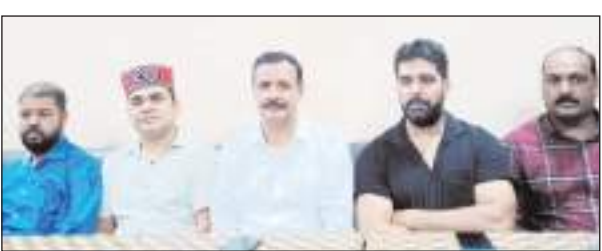
एक भी पूरा नहीं हुआ है जिससे जनता खुद को ठगा हुआ महसूस कर रही है जबकि केंद्र सरकार की योजनाएं लोगों को लाभान्वित कर रही है। उन्होंने कहा कि रक्षाबंधन के त्योहार पर घरेलू गैस सिलेंडर के दाम 200 रु घटाकर प्रधानमंत्री नरेंद्र मोदी ने बहनों को बड़ा तोहफा दिया है। इसी प्रकार उज्ज्वला योजना के अंतर्गत लाभार्थियों को सिलेंडर 400 रु