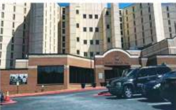
जेल में लगातार कैदियों की संख्या बढ़ती जा रही है। जेल की दीवारें भी टूट गई हैं, जिसका फायदा उठाकर कैदियों द्वारा हथियार तैयार किए जा रहे हैं। बाद में वे इन्हीं हथियारों का एक दूसरे और पुलिस कर्मचारियों पर हमला करने के लिए इस्तेमाल करते हैं।