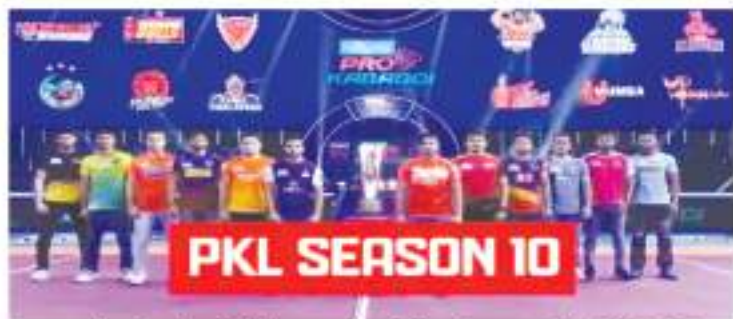
कहा, +हमें एशियाई खेलों में कबड्डी टीमों की चल रही तैयारियों के मद्देनजर स्पर्धा के लिए भारतीय पुरुष और महिला पीकेएल सीजन 10 खिलाड़ी नीलामी को

मुंबई। प्रो कबड्डी लीग (पीकेएल) के आयोजक मशाल स्पोर्ट्स ने पीकेएल सीजन 10 खिलाड़ियों की नीलामी को बाद की तारीख तक स्थगित करने की घोषणा की है। यह निर्णय भारत में कबड्डी के लिए आधिकारिक तौर पर मान्यता प्राप्त संस्था, एमैच्योर कबड्डी फेडरेशन ऑफ इंडिया (एकेएफआई) के प्रशासक के अनुरोध पर लिया गया है। खिलाड़ियों की नीलामी पहले 8-9 सितंबर 2023 को होने वाली थी।