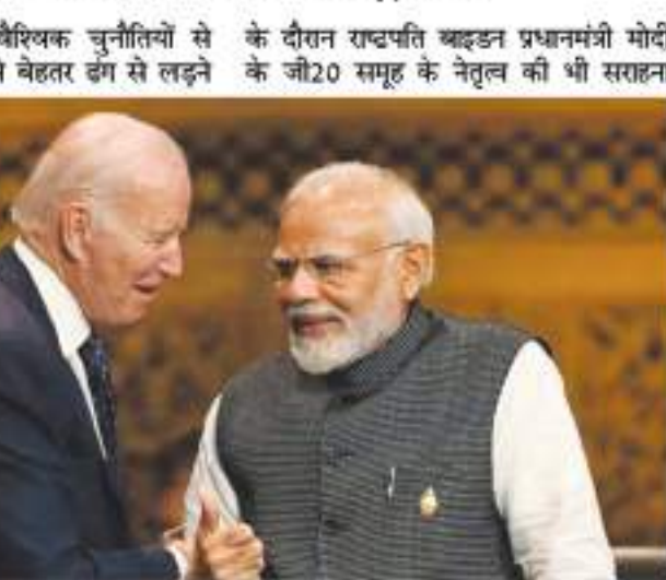
के लिए विषय बैंक सहित अन्य बहुपक्षीय विकास बैंकों की क्षमता बढ़ाने के उपायों पर भी चर्चा करेंगे। बयान के मुताबिक, नई दिल्ली की यात्रा

करेंगे। जी20 नेता वैश्विक चुनौतियों से निपटने और गरीबी से बेहतर ढंग से लड़ने के दौरान राष्ट्रपति बाइडन प्रधानमंत्री मोदी के जी20 समूह के नेतृत्व की भी सराहना करेंगे। वह आर्थिक सहयोग के प्रमुख मंच के रूप में जी20 के प्रति अमेरिकी प्रतिबद्धता की पुष्टि करेंगे, जिसमें 2026 में समूह की मंजबानी भी शामिल है।